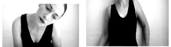
per ego. Their superego is never so inexorable. rather than confrontation can lead to either an

Fort du succès de l'exposition environnante FSPACE lors du 18e festival, l'équipe persiste et signe en proposant une seconde version FSPACE intitulée : Performer le genre. Cette exposition s'attachera plus particulièrement aux formes émergentes et novatrices de l'art contemporain liées aux questions de genre .