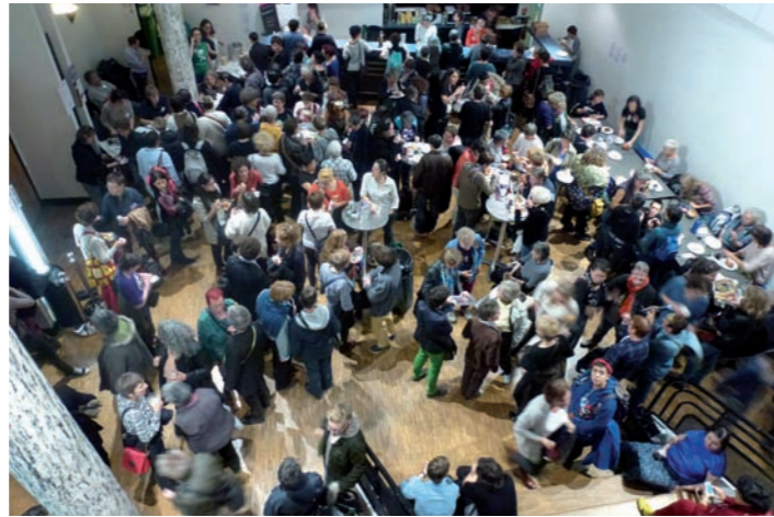
26 e festival de Cineffable du 30 octobre au 2 novembre à l'Espace Reuilly

Ces éléments ont probablement contribué à la légère baisse de fréquentation enregistrée par rapport à l'édition précédente (-1,8%), avec 1244 adhérentes. La part des adhésions à tarif réduit diminue légèrement tandis que les adhésions de soutien continuent d'augmenter (+4%). Les festivalières ont participé en nombre au système solidaire des « tickets suspendus » mis en place pour permettre l'accès aux projections à celles dont les moyens financiers sont limités.