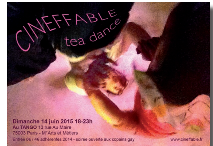
Dimanche 14 juin 2015 18-23h Au TANGO 13 rue Au Maire 75003 Paris - M° Arts et Métiers Entrée 6€ / 4€ adhérentes 2014 - soirée ouverte aux copains gay www.cineffable.fr