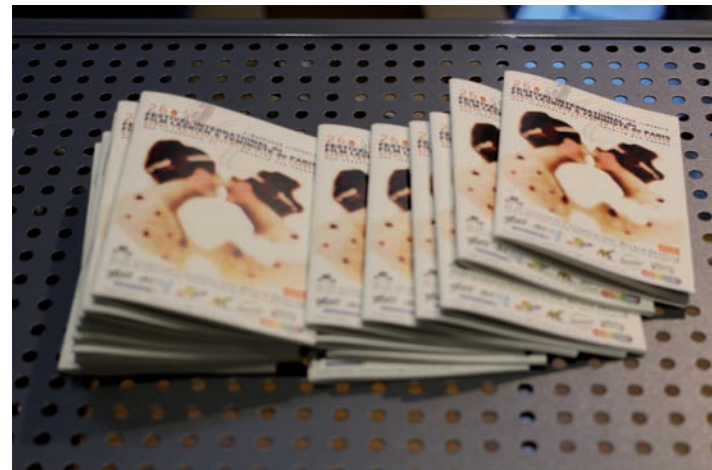
Programmes de Cineffable en 2014

Le 5 e Printemps de Cineffable , qui a eu lieu le 14 mai dans la salle Olympe de Gouges (Paris 11), a connu une fréquentation décevante mais a toutefois permis de dégager un excédent de 450 € qui a été reversé en soutien aux Talented Ugandan Kuchus (TUK) avec qui la soirée avait été organisée. Depuis septembre 2014, des séances de projection sont proposées régulièrement en partenariat avec le 3W Kafé. La Ville de Paris a reconduit sa subvention de fonctionnement à hauteur de 4000 €. Au cours de l'année, les prix des concours de scénario 2011 et 2012 ont été versés à leurs lauréates. Le premier, Waterproof , a été présenté au 26 e festival tandis que le second, A qui la faute ? , le sera lors de la prochaine édition. Le prix du scénario 2014 n'a pas été attribué car le seul scénario reçu n'était pas convaincant.