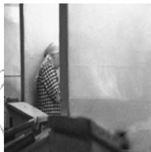
Et Sheaava Nafshi (Keep Not Silent)