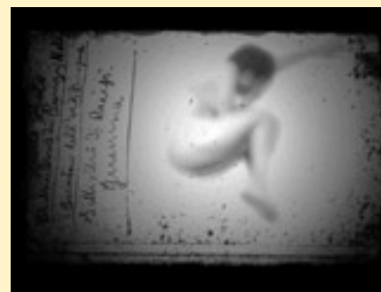
Collectif Lemeh42 (Italie) Study on human form and humanity - Vidéo

L'exposition F_SPACE 3 regroupera une sélection d'artistes européennes contemporaines proposant toutes des projets spécifiques pour le lieu et le festival. La sélection compte 7 projets venus du Danemark, d'Autriche, d'Italie, d'Angleterre et de France, allant de performance - marches de l'anglaise