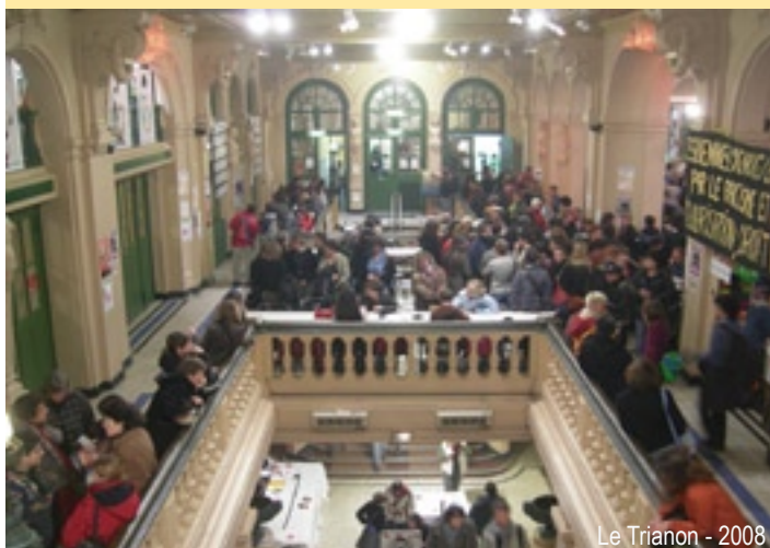
Le Trianon - 2008

La Halle Saint-Pierre (films et débats) 2 rue Ronsard 75018 Paris Métro Anvers (ligne 2) - Bus 30, 54 www.hallesaintpierre.org