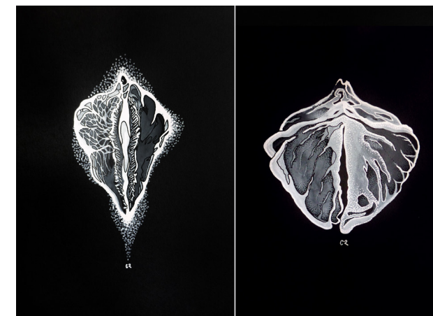
Diptyque, projet Don't try to cunt them all / Cassie Raptor

NICOLE BAILLEHACHE (sculpture), MARIE DOCHER (photographies et vidéos), CASSIE RAPTOR (dessins et vidéos), U-VULVA (photographies et vidéos) et LORI MALEPART-TRAVERSY (film d'animation)