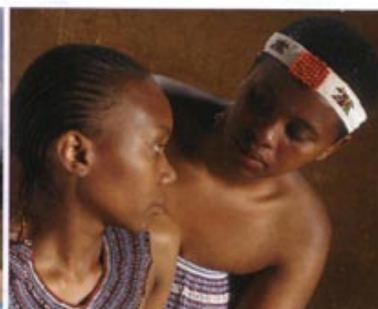
Photo du film Night Star , court métrage de fiction de Kekeletso Khena (Afrique du Sud, 2007)

rétrospective de courts métrages et une rencontre/débat autour de l'histoire du festival, du chemin parcouru mais aussi des perspectives pour l'avenir du festival.