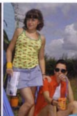
Pépita, Kitty et l'utérus artificiel