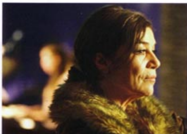
Photo du film Vivere , long métrage de fiction de Angelina Maccarone (Allemagne, 2007)