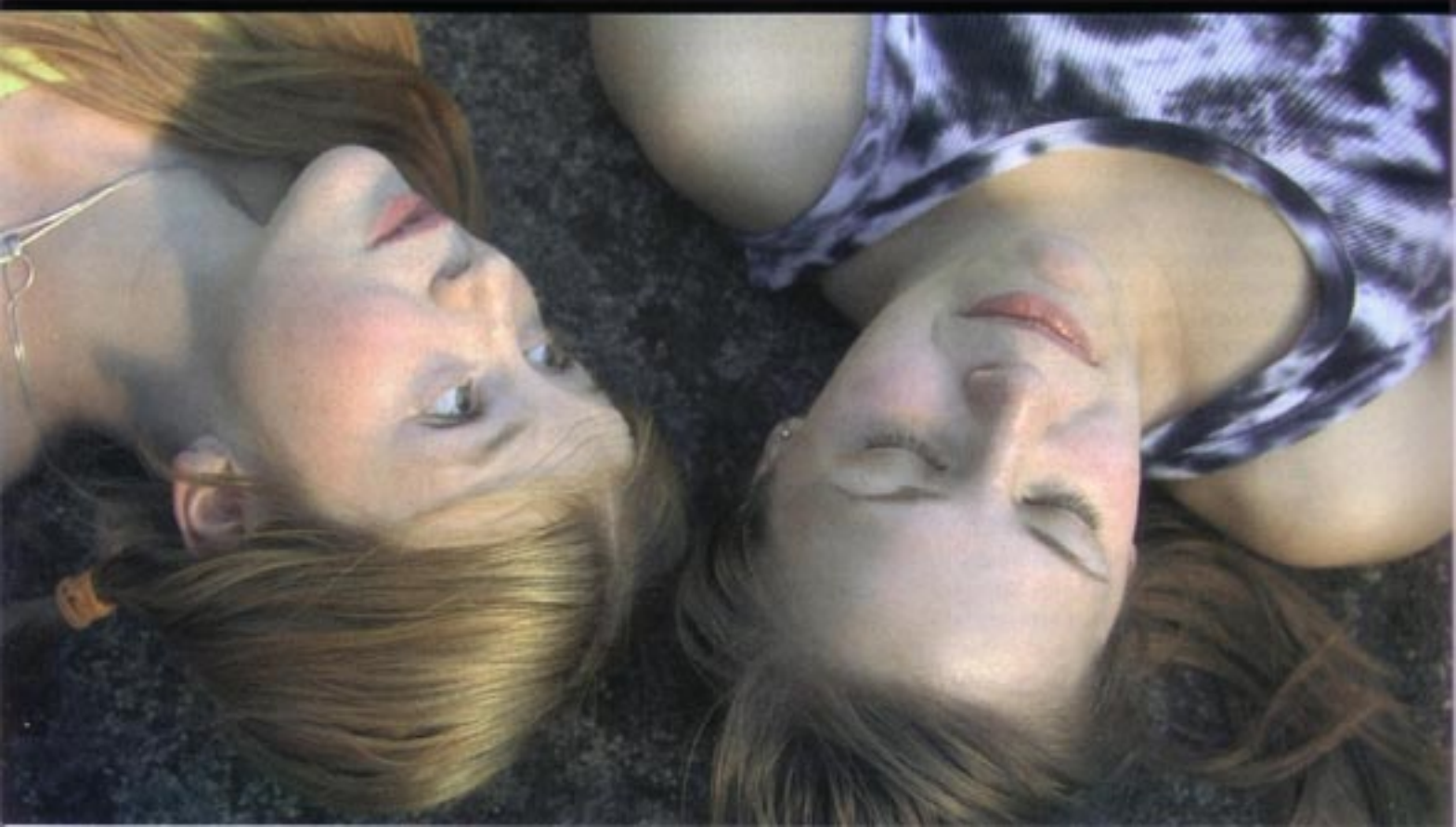
Photo du film Pusinky (Dolls / Demoselles) , long métrage de fiction de Karin Babínska (Rép. tchèque, 2007)

entièrement gérée par l'équipe au profit du festival. Cet événement majeur de la communauté lesbienne, réservé aux femmes en vue de privilégier les échanges et la construction d'une identité commune dans sa diversité, fête ses 20 ans en 2008. À cette occasion, les organisatrices présentent, en association avec Lesbia Mag , une exposition, une