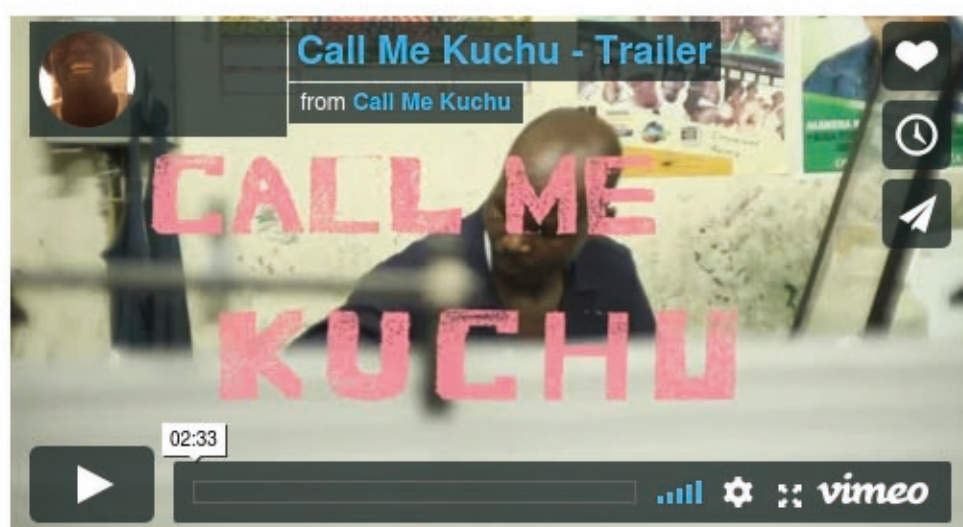
Call Me Kuchu - Trailer from Call Me Kuchu on Vimeo.

Aussi, et de façon tout aussi impartiale, nous vous proposons d'assister à la séance "Gazon et crampons" du dimanche à 16h30 pour voir l'excellent documentaire d'Hélène Harder, Ladies's turn , sur le premier tournoi de foot féminin au Sénégal. S'en suivra une discussion avec la réal et les Dégommeuses .